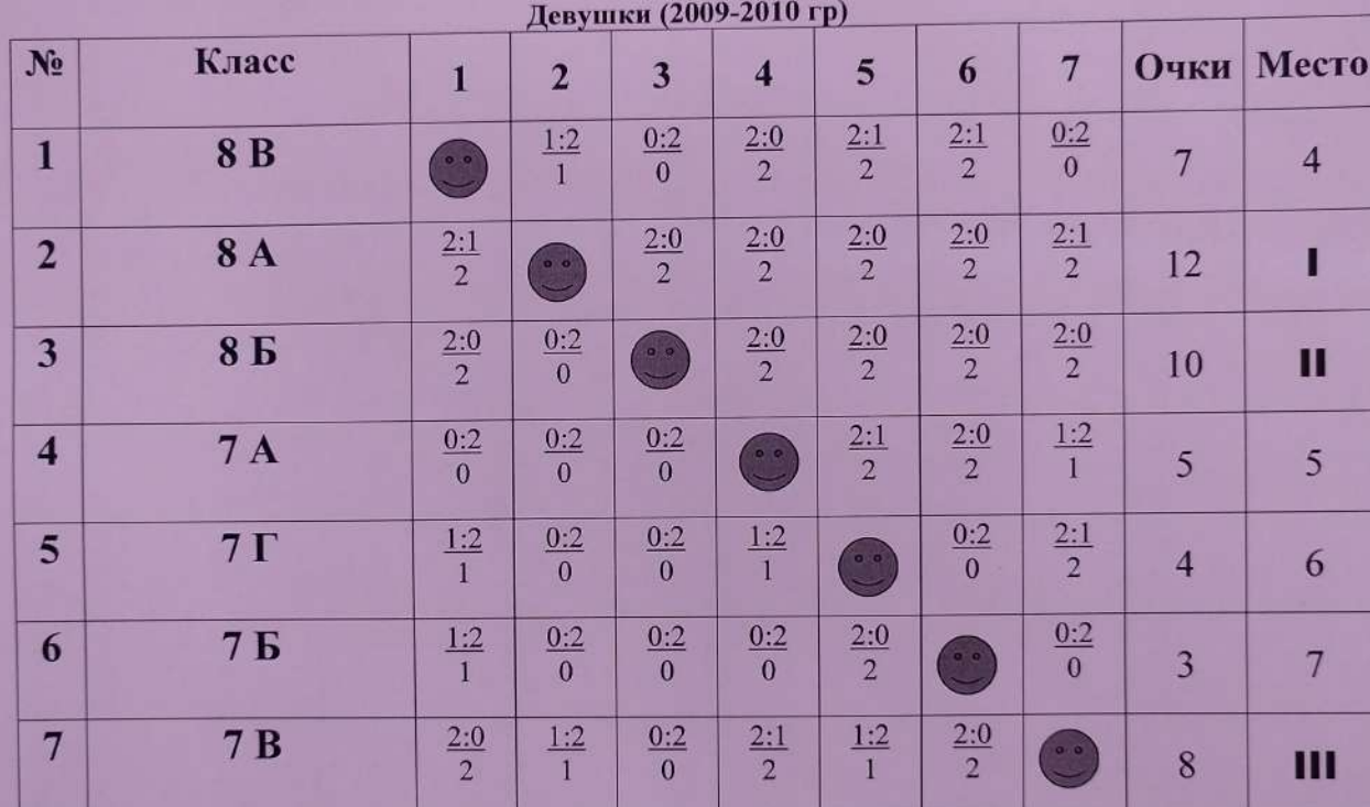
Таблица розыгрыша Школьного этапа спортивных игр школьников «Президентские спортивные игры» «Волейбол» Девушки (2009-2010 гр)